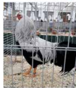
Twentse Hoen haan fraaiste hoen op Zuiderzeeshow

De showende leden vinden elkaar op diverse districtshows, de herfstclubshow in Rijssen, de winterclubshow op de Oneto in Enschede en de KLN bondsshow in Assen.